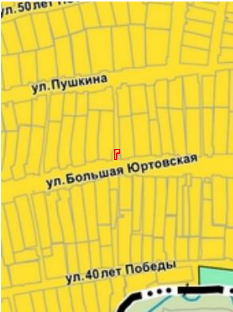
Зона индивидуальной жилой застройки (Ж1)