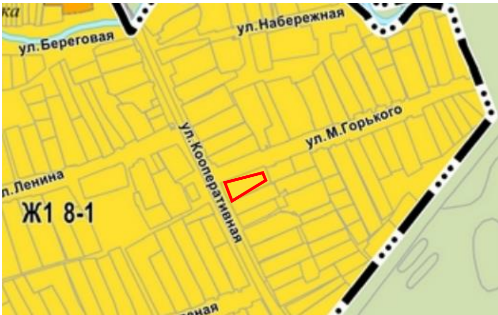
Зона индивидуальной жилой застройки (Ж1)