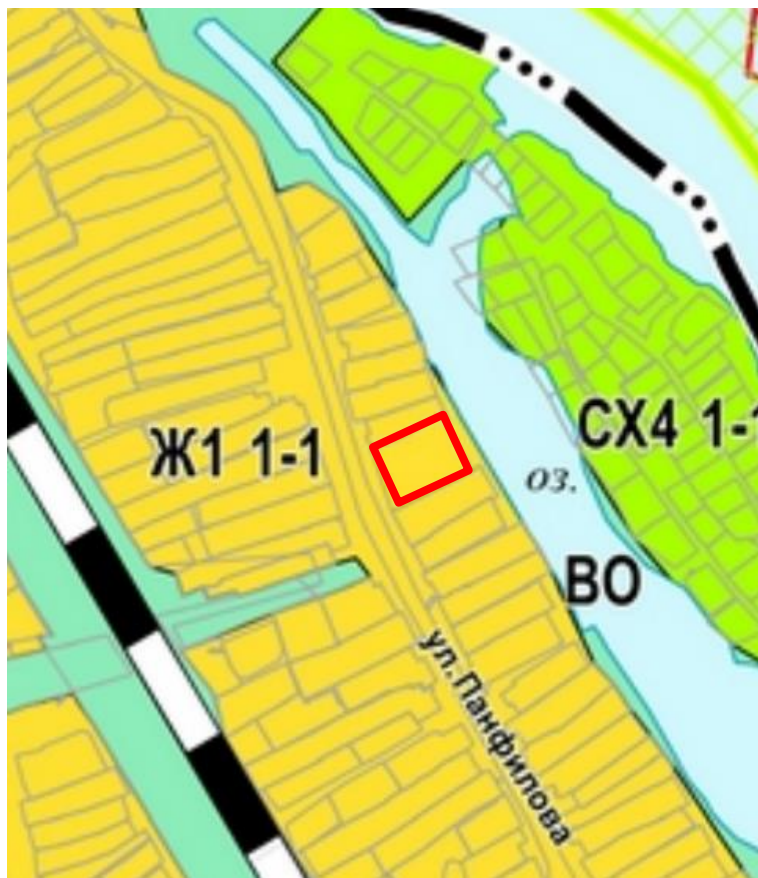
Зона индивидуальной жилой застройки (Ж1)