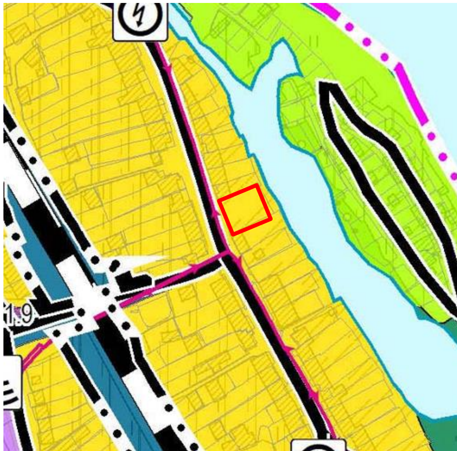
Зона застройки индивидуальными жилыми домами